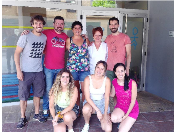
El equipo profesional posa delante de la entrada del nuevo Centro de Día.

Tras más de catorce años ubicado en la calle Joaquín Beunza, el recurso se ha trasladado a esta localidad navarra con el objetivo de mejorar la intervención y ofrecer un mejor servicio.