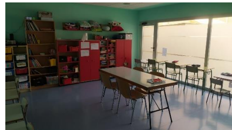
Una de las nuevas salas, más luminosa y espaciosa.