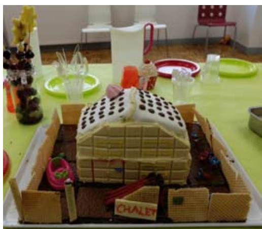
El ganador del concurso "Le Grand Chef" fue la recreación pastelera del chalé del COA.