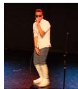
Izda: la actuación con más mensaje. Dcha: el segundo premio de esta edición.