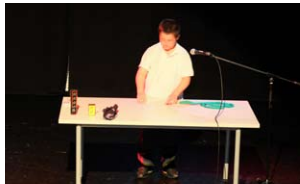
El show de magia ganó el primer premio.

Al término del espectáculo se repartieron los premios y diplomas de participación.