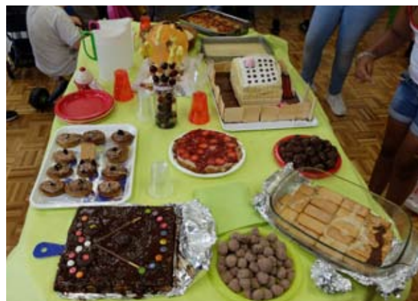
Trufas, brochetas de frutas, tartas, lasagna y cupcakes participaron en el concurso "Le Grand Chef".