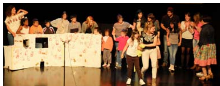
El equipo del COA que recibió el tercer premio por su emotivo lipdub .