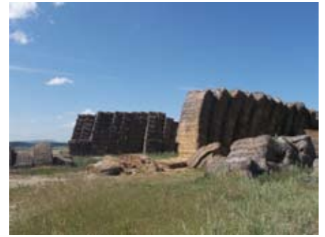
Sin título 2. G.D.