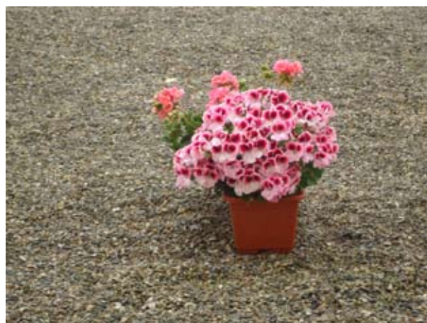
“Sentimientos”, de I.M.

La entrega de diplomas y premios tuvo lugar el 17 de junio en el Servicio Municipal de Atención a Personas Sin Hogar. Una cita a la que asistieron varios de los participantes en el certamen que tuvieron la oportunidad de explicar el significado de cada una de las imágenes que presentaron. Tras la entrega se sirvió un pequeño aperitivo para todos los allí presentes.