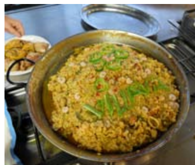
Paella de pescado. Villava 1.