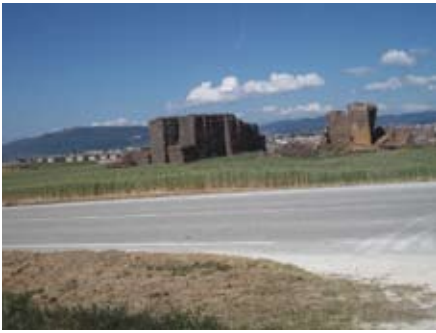
Sin título 1. G.D.