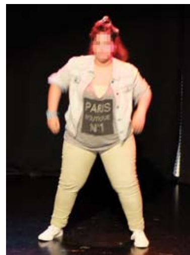
Al ritmo de zumba bailó esta joven del hogar de Buztintxuri.