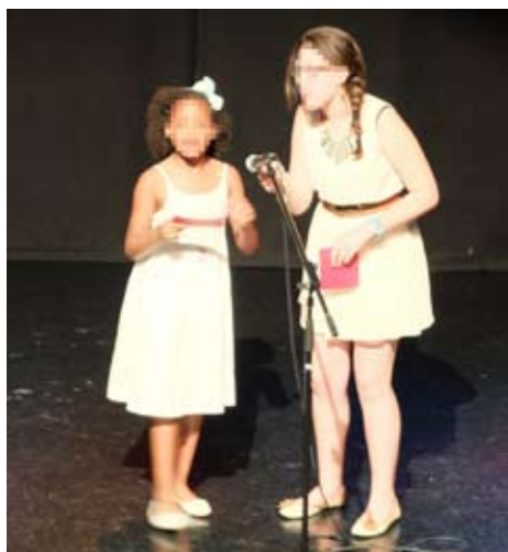
Las presentadoras del evento demostraron muchas tablas sobre el escenario.