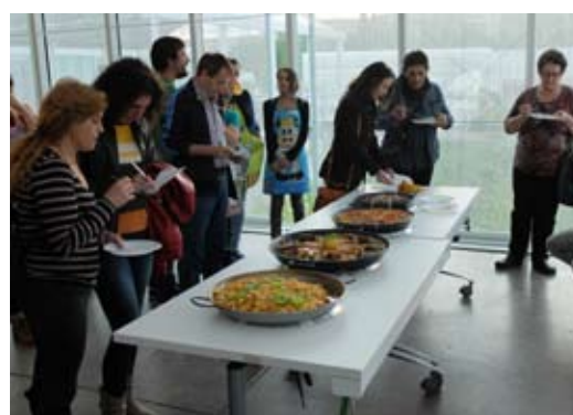
El jurado probando las paellas.