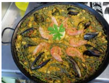
Paella de marisco. Oficinas.