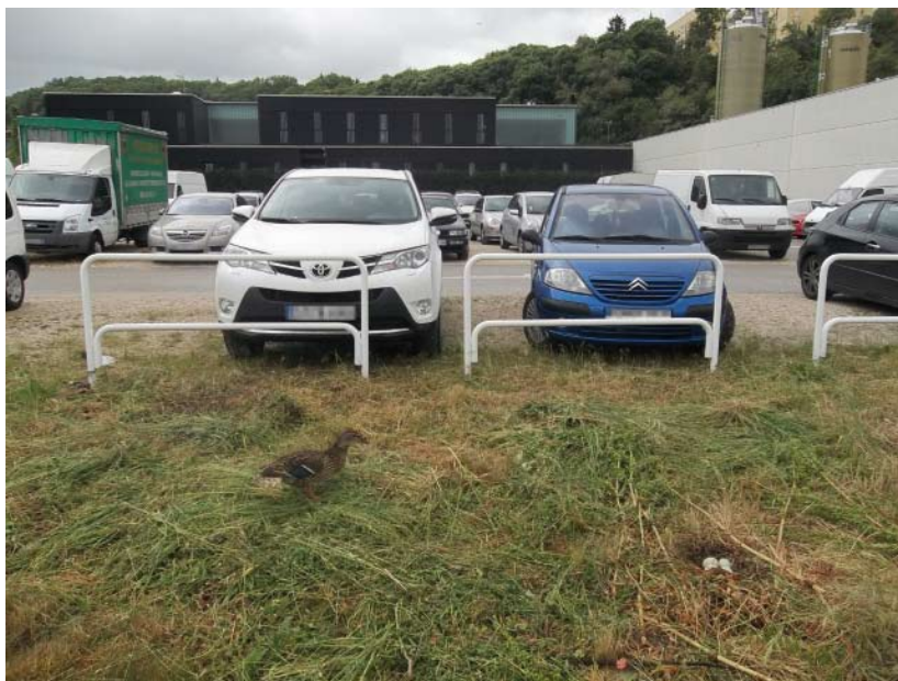
Imagen ganadora de esta tercera edición.

Por tercer año consecutivo Fundación Xilema organizó, en colaboración con el Ayuntamiento de Pamplona, el “Concurso de fotografía de primavera” dirigido a las personas usuarias del Servicio Municipal de Atención a Personas Sin Hogar. En esta ocasión se presentaron 16 imágenes muy variadas, algunas con el paisaje como protagonista y otras con escenas del día a día.