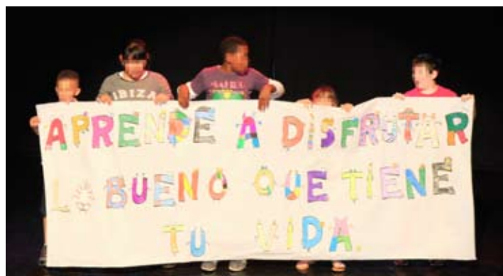
El grupo de medianos y mayores del Centro de Día terminaron su actuación con un bonito mensaje.