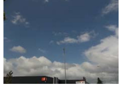
El lugar de nadie. P.E.