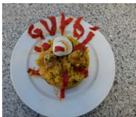
Gurbi Paella. Ermitagaña.