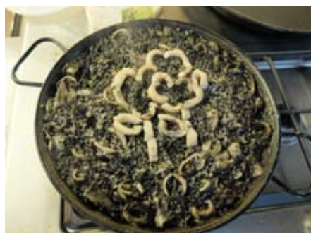
Arroz negro. Equipo Directivo.