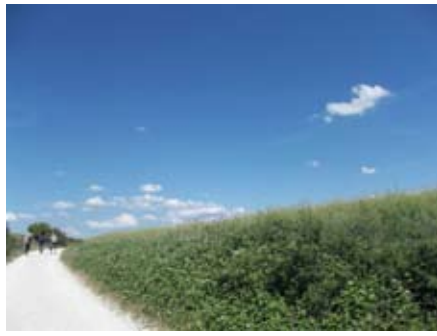
Feliz en el camino del Perdón. D.O.