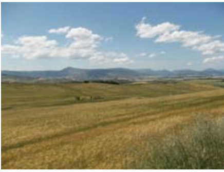
Cielo abierto. D.O.