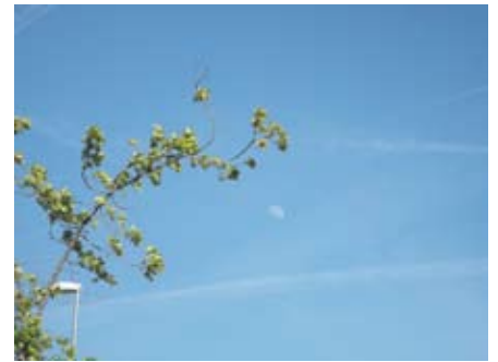
Porque me gustó. M.P.