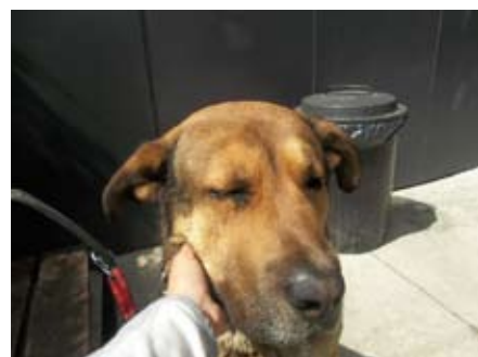
Durmiendo en el albergue, R.B.