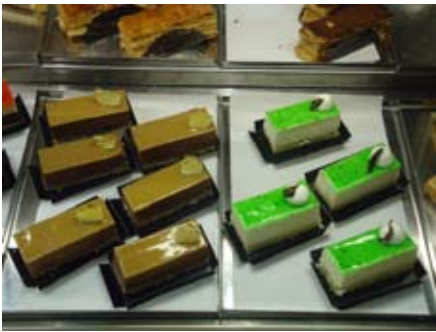
La vida dulce. I.M.