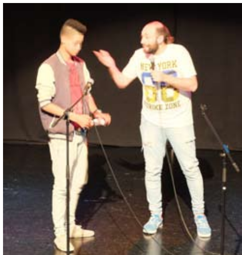
Desde Villava 1 nos trasladamos a los 90 con la canción del Príncipe de Bel-Air.